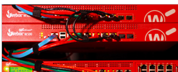
Seguridad de red