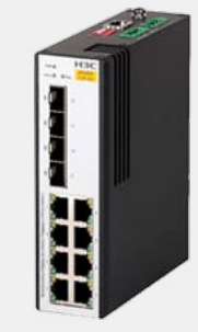
Série IE4300 Switches Industriais