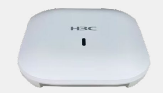
Pontos de Acesso