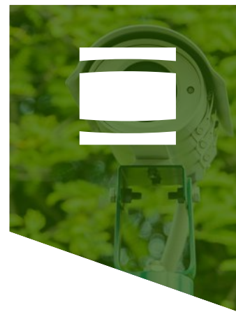
CCTV & INDUSTRIAL