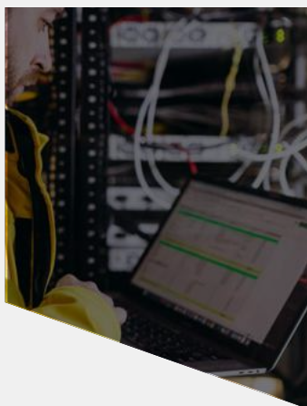
SERVICIOS PROFESIONALES COMUNES